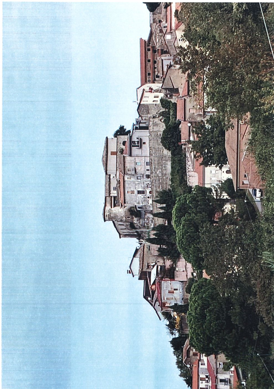
PROSPETTO MURD VIA DELVEDERE - PARCO GIARINO COMUNALE